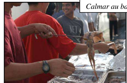
Calmar au barbecue