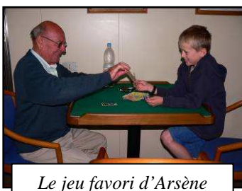
Le jeu favori d'Arsène