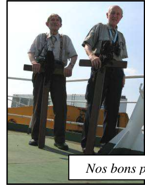
Nos bons pasteurs

d'accès). Vous raconter le voyage bord est très simple : tout est rythmé de la même manière, tout est rythmé par les trois repas du jour. Nous sommes au pont n°12, au pont de l'équipage et des officiers. Nous mangeons dans l'espace réservé aux officiers. Une partie est Philippin tandis que les officiers supérieurs sont Suédois. Une table est réservée