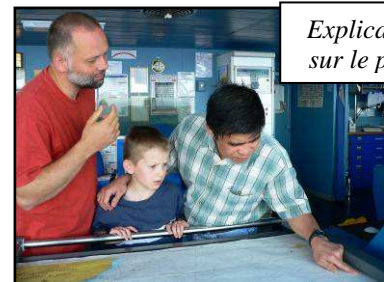
Explications sur le pont !