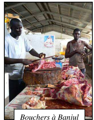
Bouchers à Banjul