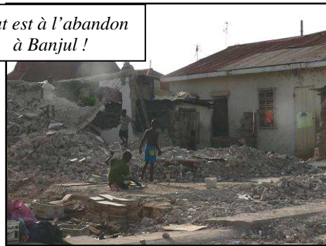
Tout est à l'abandon à Banjul !