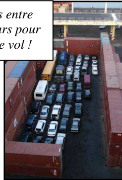
Des voitures entre des conteneurs pour empêcher le vol !

Nous en profitons aussi pour en savoir plus sur le « monstre marin » qui nous accueille. L'équipage reste courtois mais on sent bien « qu'on » travaille ici. Tout est démesuré, et le travail aux quais se fait souvent de nuit pour gagner du temps. Le bateau doit naviguer le plus souvent. Question de rentabilité. Le déchargement est toujours fait par le personnel du port. Nous lisons, jouons et regardons attentivement toutes les