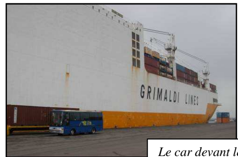
Le car devant le bateau !