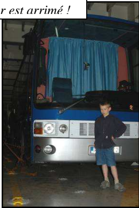
Le car est arrimé !

Le car est toujours dehors. Bien vite un des officiers nous propose de le rentrer à bord avant que d'autres voitures ne se présentent. Quel ne fût pas sa surprise de voir notre « voiture » ! Plus grande que prévu pour lui ! Mais l'accueil reste chaleureux et il nous trouve une place « d'attente ». Le voici à bord bien enchaîné. Le voyage peut commencer. Le départ est prévu demain matin. Nous en profitons pour regarder l'embarquement de la marchandise à bord. Nous sommes dans un bateau Co-Ro c'est-à-dire qu'il peut à la fois charger des containers et des voitures (via une rampe