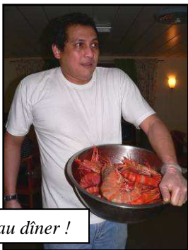
Crevettes au dîner !